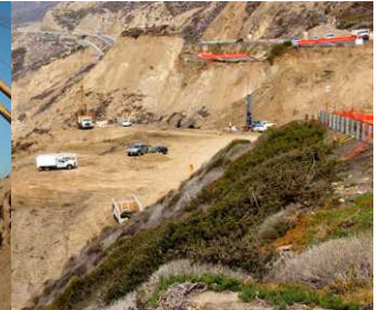
Carretera Escénica Tijuana-Ensenada