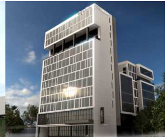
Hotel City Suites.