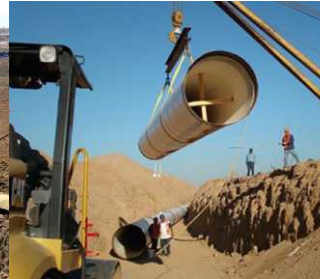
Linea Hidráulica Ensenada