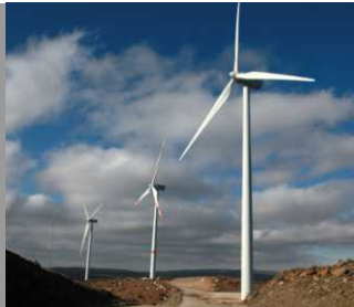
Sierra Juarez etapa 2