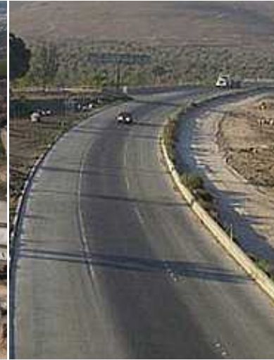
Carreteras y autopistas