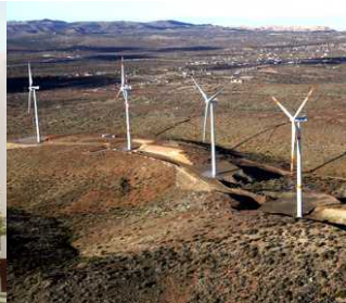
Parque Eólico Sierra Juárez