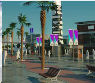
Plaza Comercial Ensenada