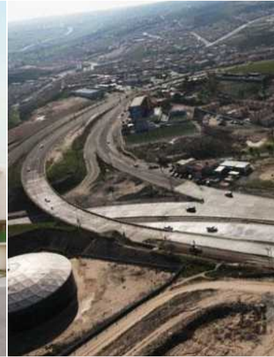
Puentes y nodos viales