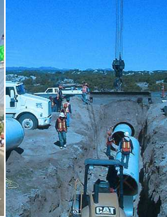
Infraestructura Hidráulica y Sanitaria

Diseño y construcción de puentes, carreteras, nodos viales, movimientos de tierra